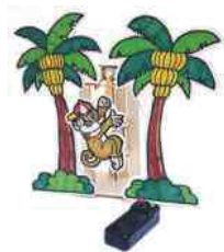
電動升降機 (馬達開關實驗)

年齡：6-12歲 費用：$1120 (7堂) 透過創意科研手工，運用STEAM (科學、科技、工程、藝術、數學) 不同學科知識，啟發學生創意思維。