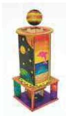
電動懸浮球 (漂浮實驗)