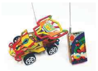
無線遙控車 (無線遙控實驗)